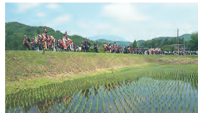
制作 岩手ケーブルテレビジョン

残したい日本の音風景百選にもなっている無形民俗文化財「チャグチャグ馬コ」。蒼前神社から盛岡八幡宮までの約14キロのパレードをダイジェストでお届けします。