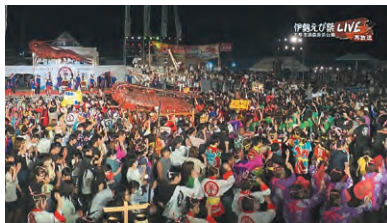
制作 松阪ケーブルテレビ・ステーション

志摩市を代表する初夏のお祭り「伊勢えび祭」。第61回を迎える今年は、あのお囃子も!踊りも!花火も!約5年ぶりのフル開催です!じゃこっぺ連がスタートする夜の部を、志摩市・浜島海浜公園から会場の熱気そのままにお届けします!